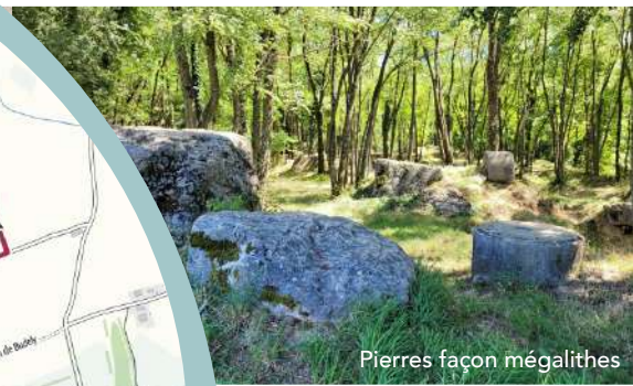
Pierres façon mégalithes