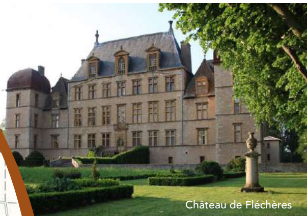
Château de Fléchères