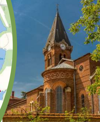
Abbaye Notre-Dame des Dombes