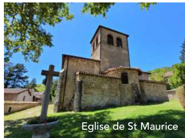
Eglise de St Maurice