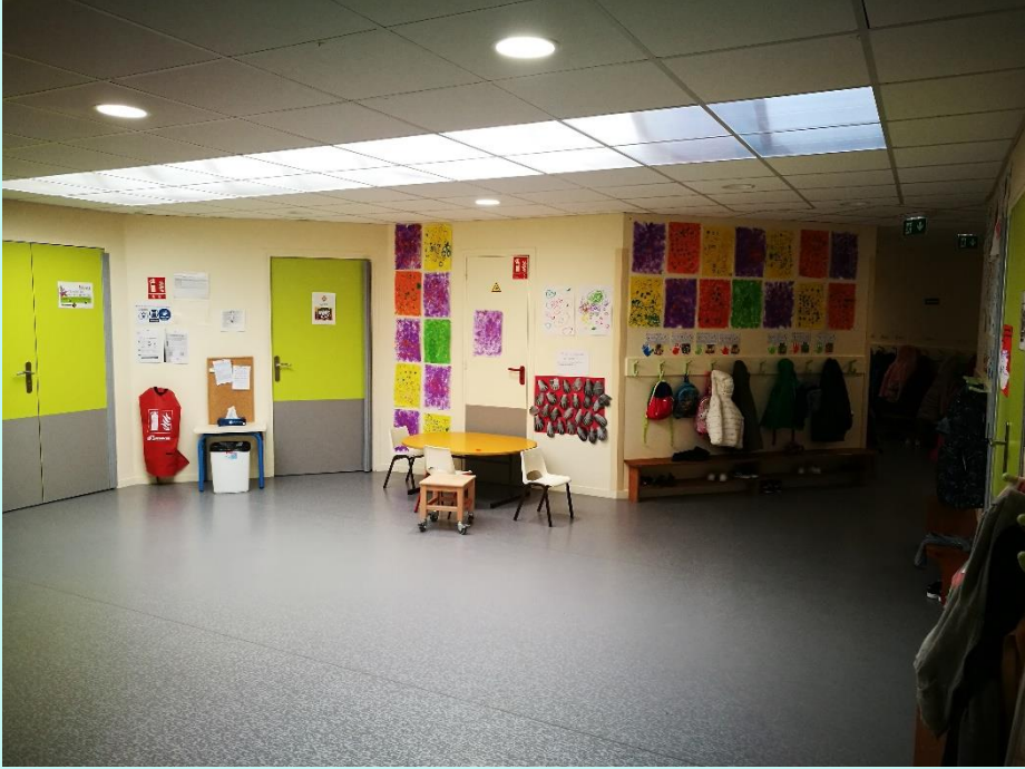
Un des trois hall de l'école